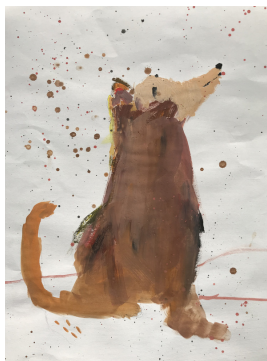
Janja Gornik, 4. razred