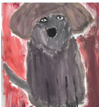
Žana Ornik, 4. razred