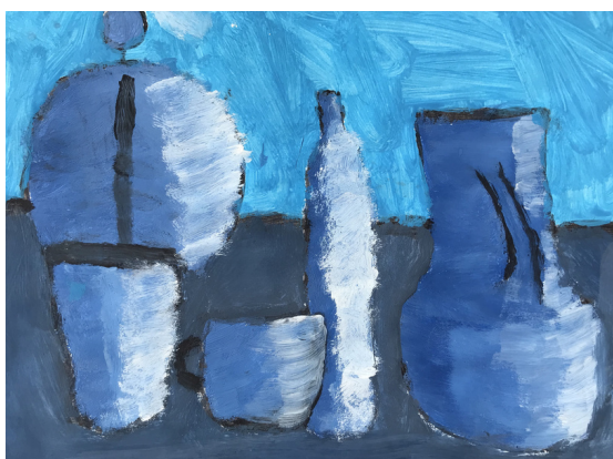
Anže Skutnik Gorgiev, 8. razred