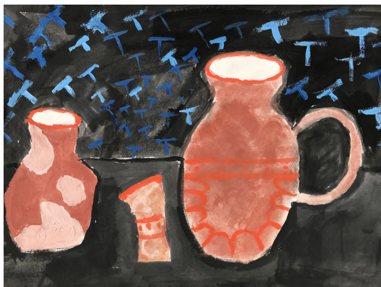
Aliya Stümpfl, 7. razred