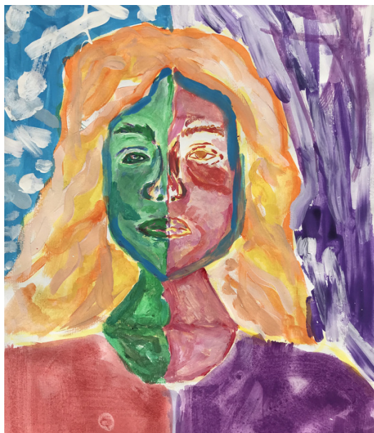
Pija Šumenjak, 9. razred