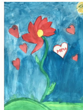
Ana Nedeljковиč, 4. razred