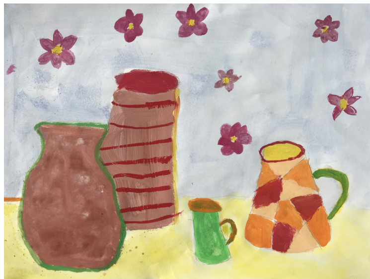
Ela Klauzner, 7. razred