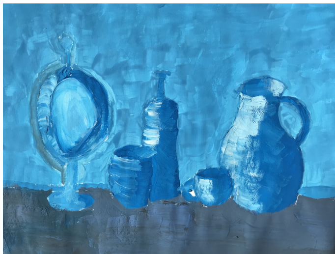
Julija Urnaut, 8. razred