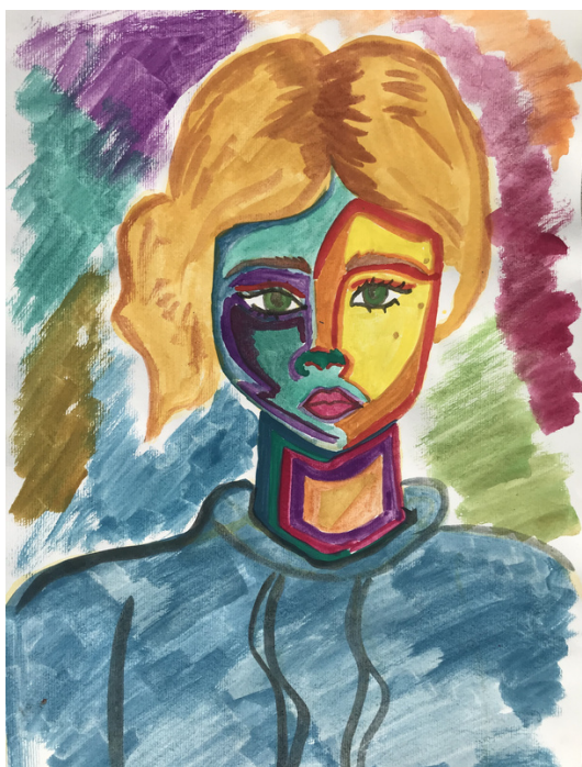
Tina Knežević, 9. razred