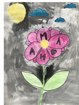
Maja Očkerl, 4. razred