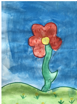
Eva Ornik, 4. razred