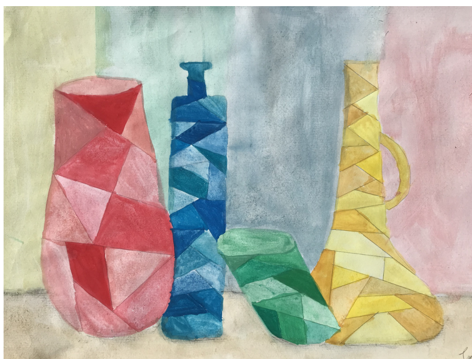
Tara Drofenik, 7. razred