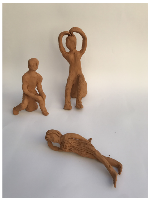
Obhodni kipi učencev 7. razreda