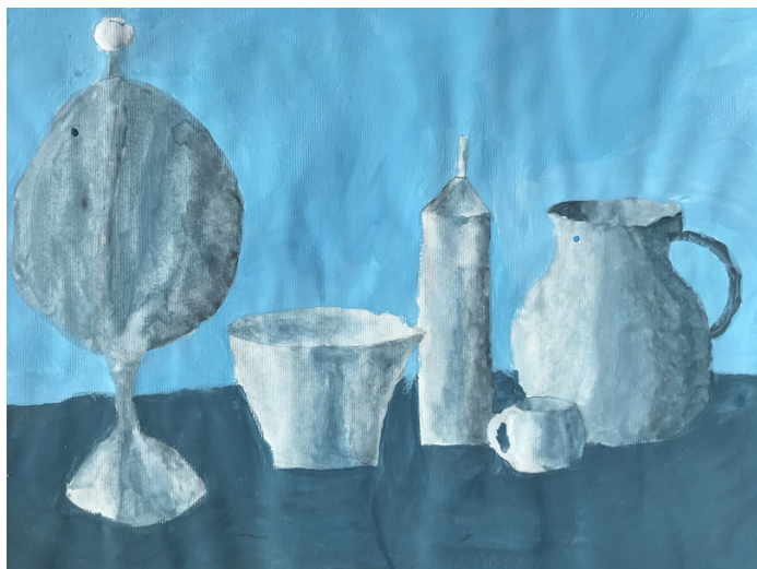
Tajda Bračko, 8. razred