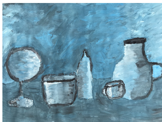
Teja Bračko, 8. razred