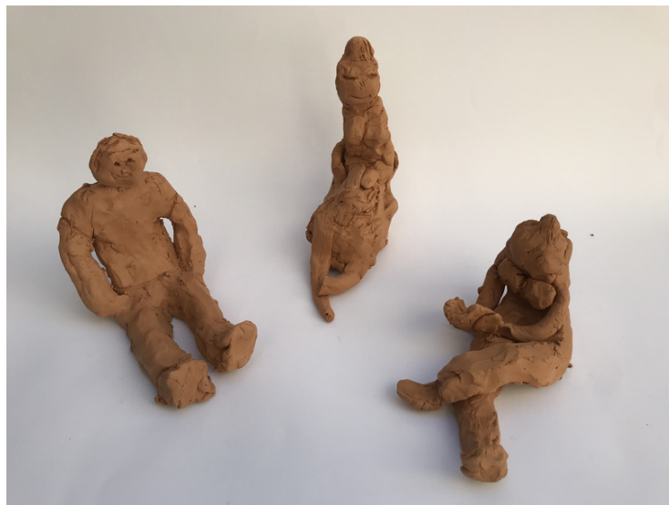
Obhodni kipi učencev 4. razreda